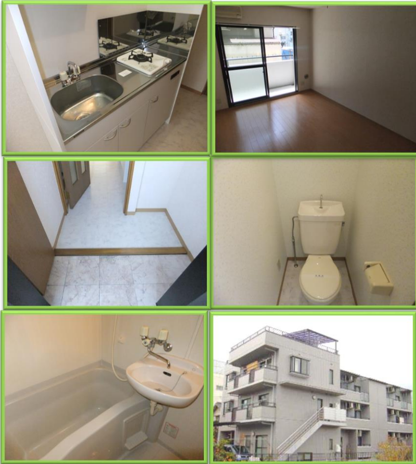
写真は別部屋・現況優先